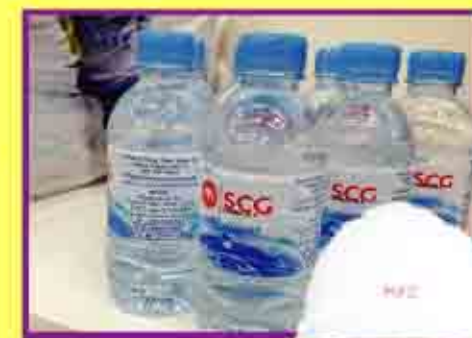
น้ำดื่มวิสาหกิจชุมชน 70,000.-