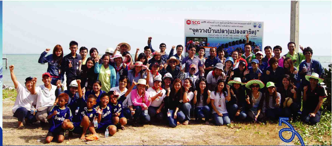
ปล่อยบ้านปลา ครั้งล่าสุด ครั้งที่ 3 ทั่วประเทศ

นอกจากนี้ ยังได้ติดตามสำรวจผลของบ้านปลา 10 หลังแรก ร่วมกับ ศูนย์อนุรักษ์ทรัพยากรทางทะเลและชายฝั่งที่ 1 โดยส่งทีมนักประดาน้ำลงไปสำรวจพบว่า มีปลาที่เป็นปลาเศรษฐกิจมาอาศัยอยู่จำนวนมากขึ้น เช่น ปลาระพง, ปลาระเบณ, ลูกปลาทุ และปูหิน ที่มีพบตามซอกหิน ซอกปะการัง แสดงให้เห็นความรู้สึกลบดกภัยเหมือนบ้าน ซึ่งชีวิตได้เบื้องต้นว่า บ้านปลาเหล่านี้ ช่วยเพิ่มทรัพยากรทางทะเลใกล้ฝั่ง เป็นแหล่งอนุบาลสัตว์น้ำ สร้างประโยชน์แก่กลุ่มประมงฯ ได้