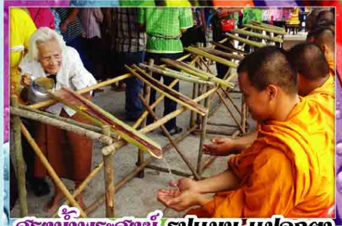
สร้างน้ำพระสงฆ์ รูปแบบ 'แปลกตา' ใครจะนำไปใช้ก็ไม่ว่ากัน ชุมชนของแตงเม