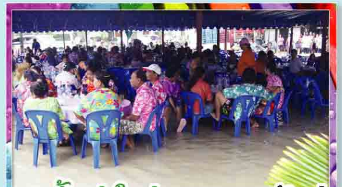
ตลาดขี้แห่งใหม่...ชาวชุมชนขี้ขล่ง เลยได้ล้อยกระทงไข่วันสงกรานต์กับจ้ำ อิม..แล้วกระทงทายไปไทขเขียะ