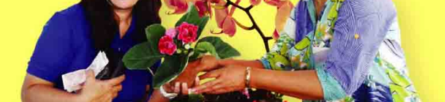
ตลาดสินค้าชุมชน มียอดขายถึง 180,000.-

* ขอบอกว่า ตั้งแต่เดือนมกราคม-เดือนมีนาคม 2556 ที่ผ่านมา เอสซีจีฯ สามารถกระจายรายได้ให้ชุมชนเพื่อนบ้านได้ถึง 4,390,000 บาท (ว้าวววว...ไม่ธรรมดาาาา)