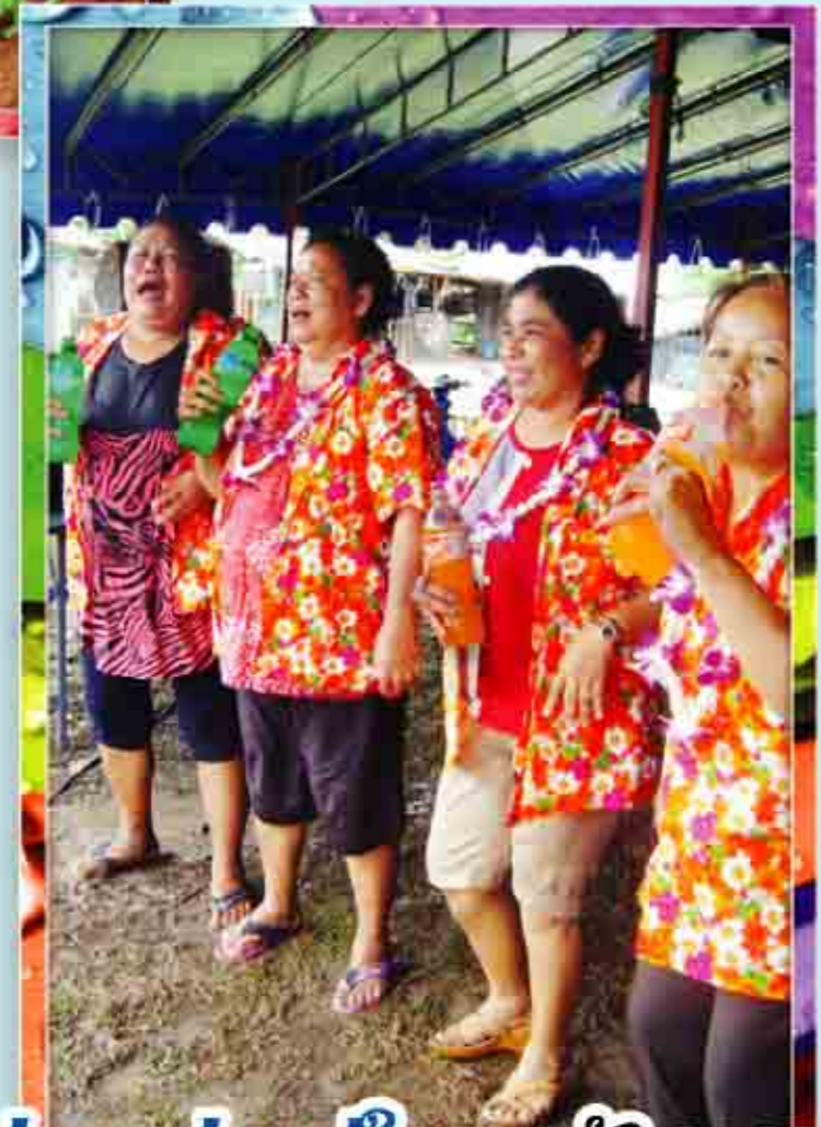
ไม่บอกว่าแม่ใคร ดูกับเอนเอง ไข่ให้ขิดว่า...ชุมชนลำขี้กกะขาก...จ้ำ

สาวๆ ชุมชนตากวบ-อ่าวประดู่ เดิมแบบแพซซ์สีลึบสโตไล แฉ่มจรัลใจไล ต้อบรับวันสงกรานต์ (จ้าว! ลอยจุงเขย)