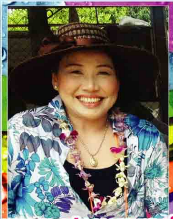
ช่วงนี้ ใครเจอรองประธานชุมชนเขียบพยอม หรือ พี่ไก่ ราชกิจขิม ลอยวันลอยคืน ลอยเต๋อจรัญ