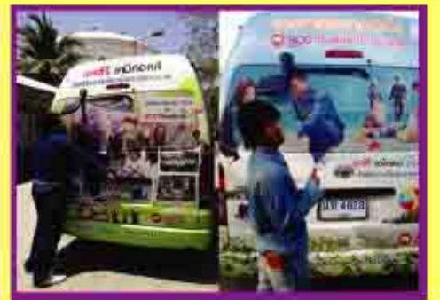
รถรับ-ส่งพนักงาน 350,000.-