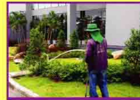
ตกแต่งสวน ดูแลต้นไม้ในโรงงาน 2,480,000.-

มาดูรายได้สะสมตั้งแต่เดือนมกราคม-เดือนมีนาคม 2556