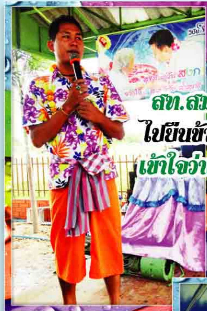
สจ. สัมหมาย ใส่กางเกงตัวขี้ ไปยืมข้างสามเมธา ดึงกางเกง เข้าใจว่าเป็นเมธเพื่อน ให้ขี้ตลง เต๋ียวโตขตุ