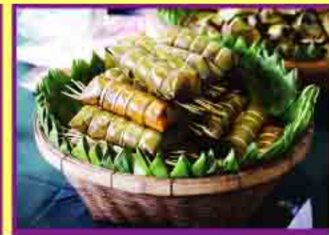
อาหารและเครื่องดื่มสมุนไพร 1,280,000.-