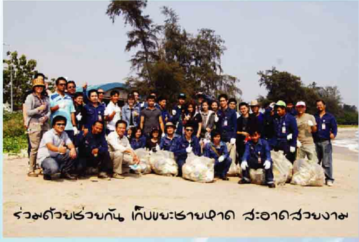
ร่วมด้วยช่วยกัน เก็บขยะชายหาด ทั่วประเทศ

เอสซีจี เคมิคอลส์ หวังว่า จากความร่วมมือของทุกภาคส่วนในโครงการ "หาดงามตา ปลากลับบ้าน" จะช่วยพัฒนาและจัดการปัญหาด้านสิ่งแวดล้อมในท้องทะเลได้อย่างเข้มแข็งและยั่งยืน เพิ่มพื้นที่อยู่อาศัย อนุบาล หลบภัยของสิ่งมีชีวิตในทะเล และส่งผลต่อสภาพเศรษฐกิจอันเนื่องมาจากเพิ่มที่อยู่อาศัยของสิ่งมีชีวิตในท้องทะเล และยังเพิ่มพื้นที่ทำอาชีพประมงอีกด้วย