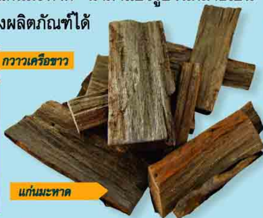
กวางเครือขาว